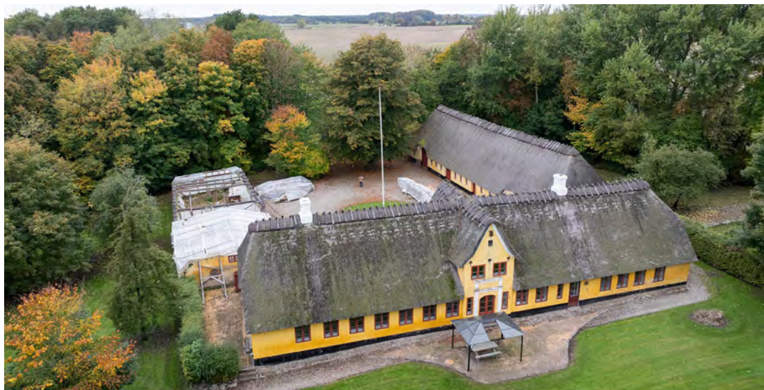
Felsted præstegård står i øjeblikket tom, da præsten er genhuset pga. skimmelsvamp.