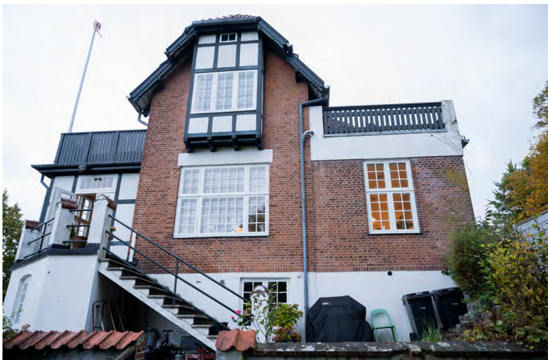
Provsteboligen i Vejle.