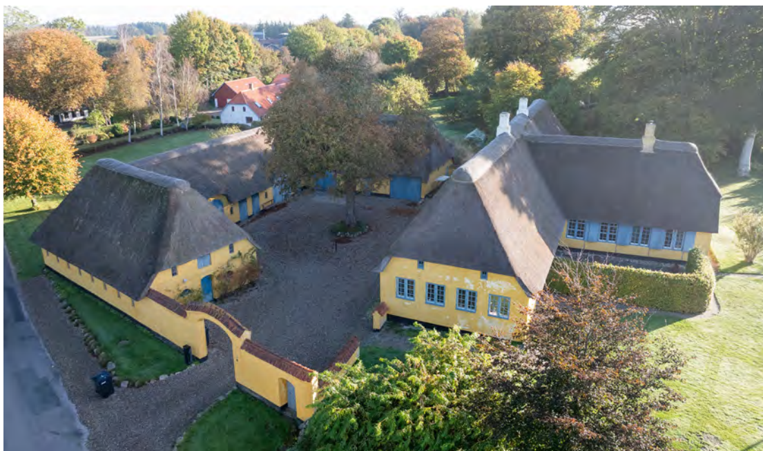
Øster Løgum præstegård har i 400 år været en central del af Øster Løgum by.