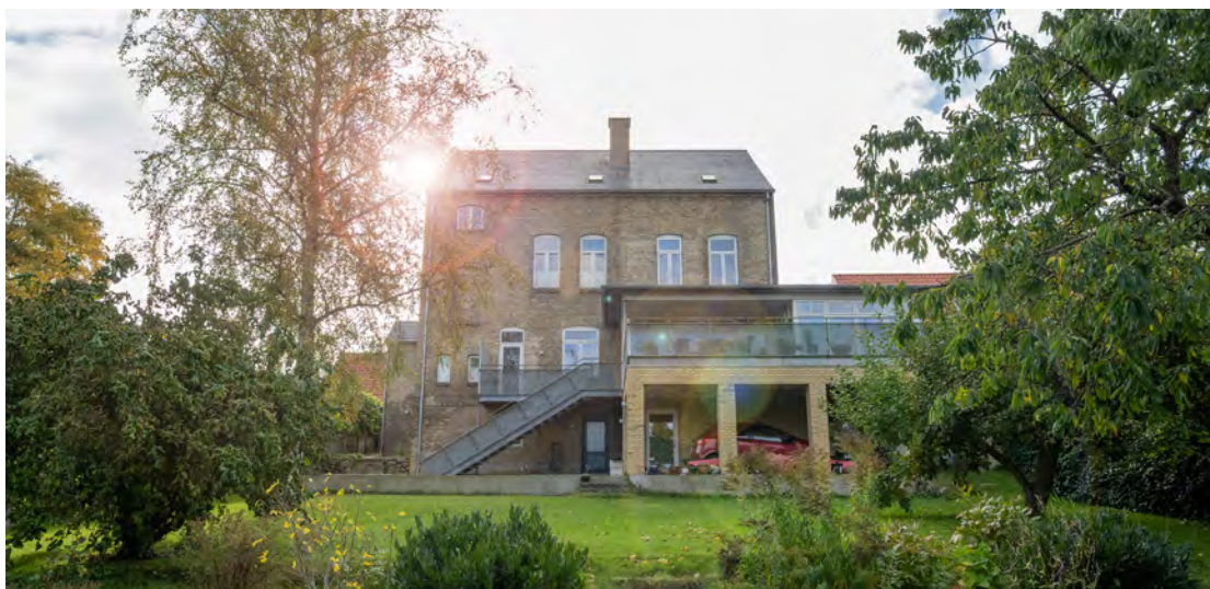
Domprovsteboligen i Haderslev, set fra haven.