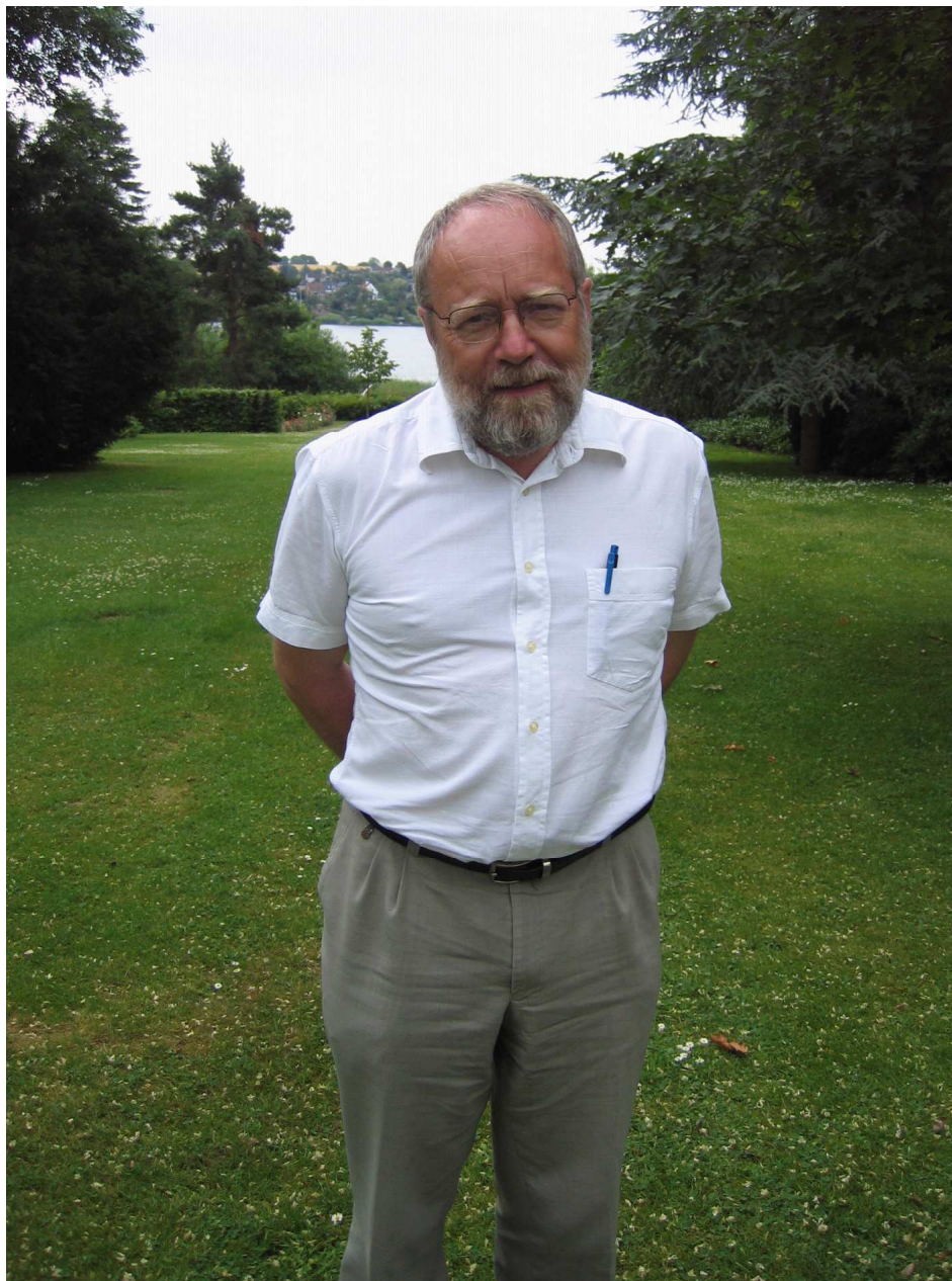
Torsdag den 23. september bliver biskoppen 60 år

Jeg har brugt mange kræfter på at deltage i gudstjenester og er snart færdig med