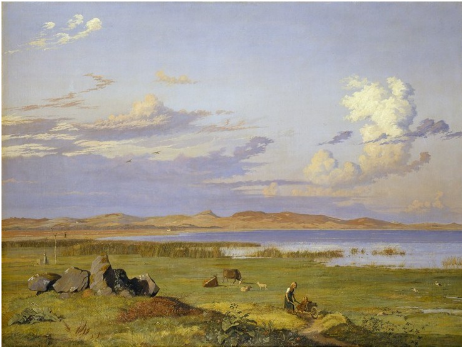
Guldalderens landskabsmalerier er vores billede af Danmark

Guds og menneskers fællesskab i verden. Vi kan spørge: Ligger der en teologi i det, vi tænker om sognet? Og hvis, hvori består den så?