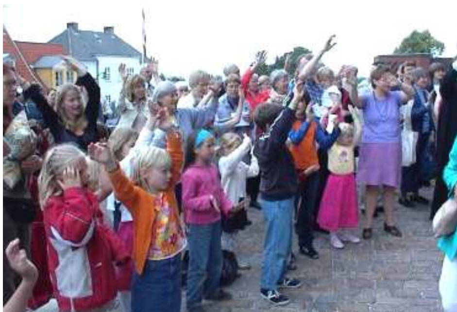
Afskedssang fra Danske Kirkedage 2004 i Roskilde. Stafetten blev her givet videre til Haderslev Stift.

Der vil på kirkedagene være målrettede programmer for både voksne, unge og børn. Så der er grundlag for en familietur.